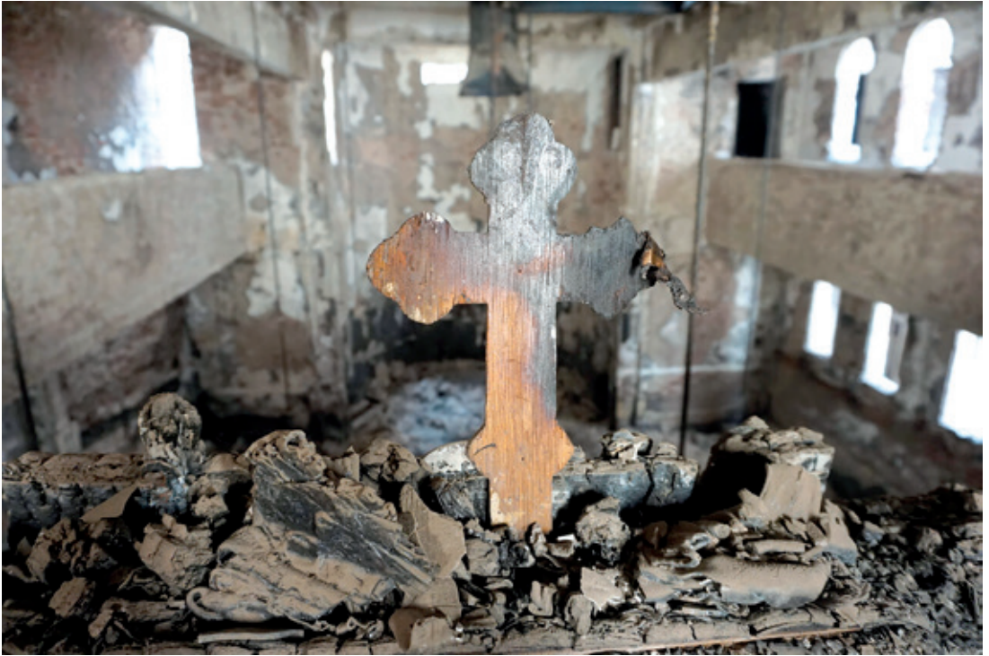
Cruz quemada en la catedral de San Jorge, Luxor.

Como establece la Declaración de la ONU, todo individuo tiene no solo el derecho a la libertad de religión, sino también el derecho a vivir su fe pública y privadamente, de acuerdo con sus creencias. Sin embargo, el auge de los autoritarismos, el terrorismo yihadista y las guerras, están asfixiando este derecho fundamental: casi dos tercios de la humanidad vive en países sin libertad religiosa.