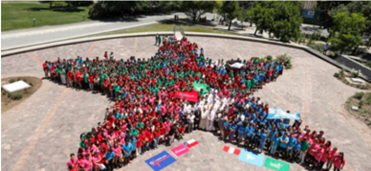
Envío de los jóvenes que participaron en las misiones y trabajos de verano.