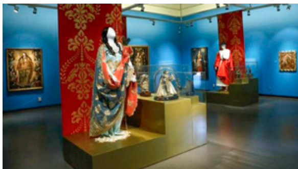
Exposición “Ropajes para la gloria” de la Colección Joaquín Gandarillas Infante

Organizada por la Dirección de Extensión Cultural UC, la exposición “Ropajes para la Gloria” se propone mostrar el modo en que durante el período barroco virreinal, el esplendor de la vestimenta y de los atuendos de las figuras religiosas refleja no solo la riqueza de moda de la época, sino que sobre todo expresa el