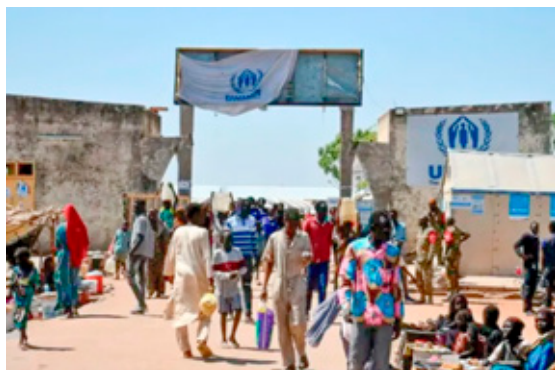
Campo de desplazados internos en Sudán del Sur.