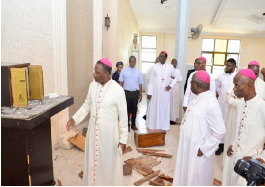
En Nigeria, obispos visitan la parroquia San Francisco Javier de Ondo tras la masacre de Pentecostés, ocurrida en junio de 2022.

Durante el período examinado han continuado las muestras de un sentimiento antimusulmán en muchas regiones de los estados miembros. Sobre todo, las mujeres musulmanas han sido víctimas de acoso, insultos despectivos y violencia, a menudo en lugares públicos, debido a su vestimenta. Como ejemplo cabe citar la agresión contra una musulmana embarazada de siete meses en una estación cercana a Florencia (Italia) por un hombre que le arrancó el burka y la sacó del tren, a ella y a su hijo de once años, a empujones.