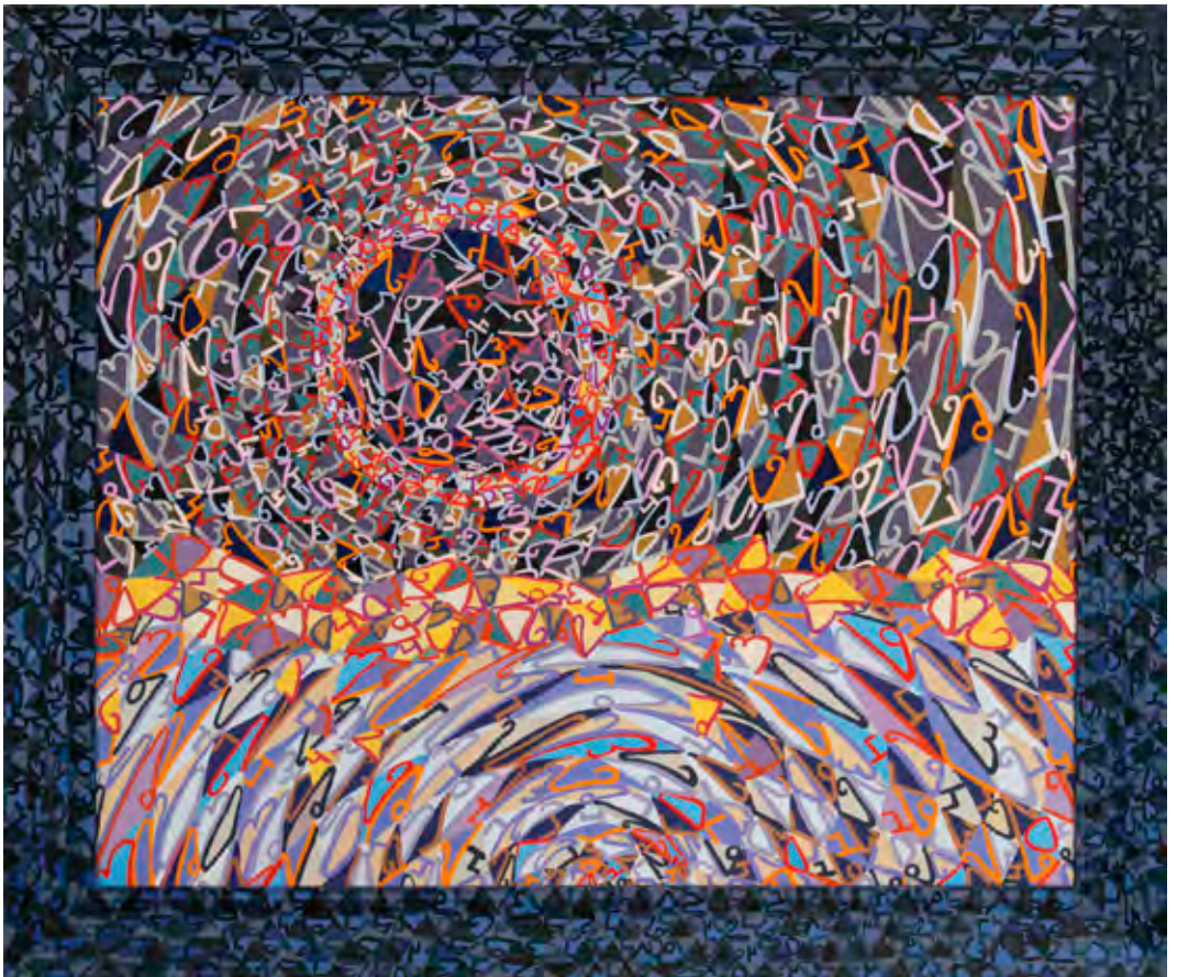
“2/7/2019” de Ximena Mandiola, 2019 (Óleo sobre tela).

El feminismo es tan heterogéneo en cuanto a tendencias que no se puede juzgar sin más su eticidad. Conviene hacer en cambio un análisis de sus presupuestos más importantes para preguntarse lo que resulta fundamental: si existe una ética femenina o un rasgo particular de lo femenino que sea un aporte original y único para contribuir a la sociedad.