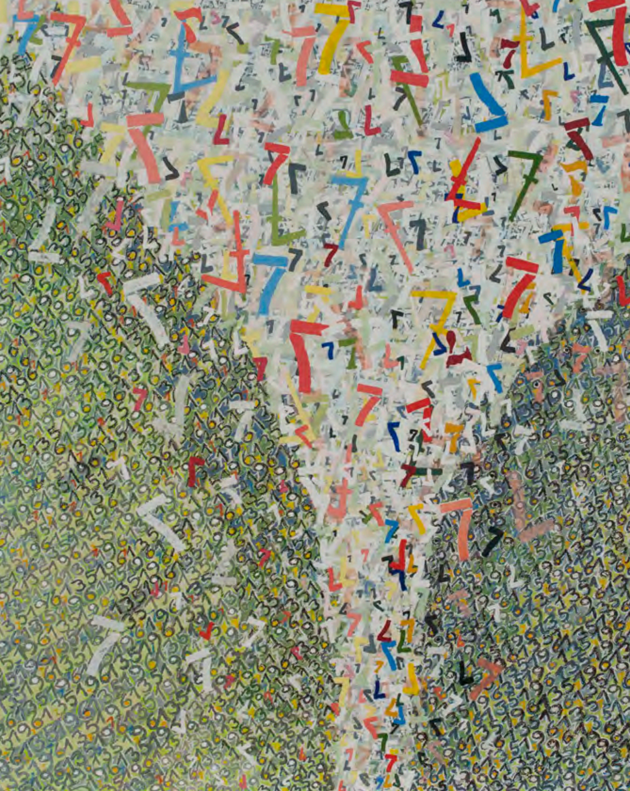
“Vórtice II” de Ximena Mandiola, 2012 (Técnica mixta sobre tela).