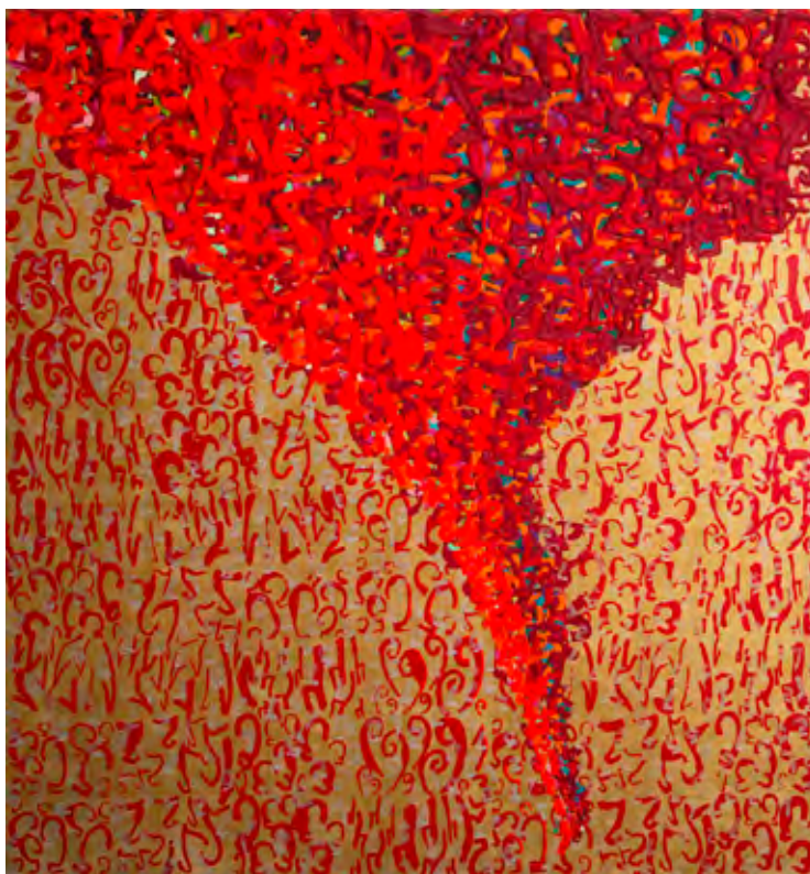
“Fantasmas esenciales” de Ximena Mandiola, 2014 (Acrílico sobre tela).