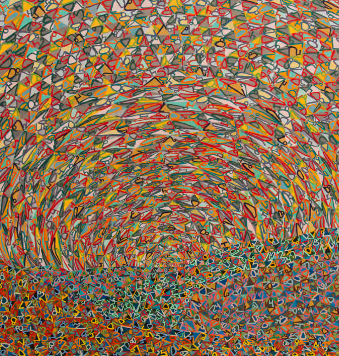
“1549208” de Ximena Mandiola, 2019 (Óleo sobre tela).