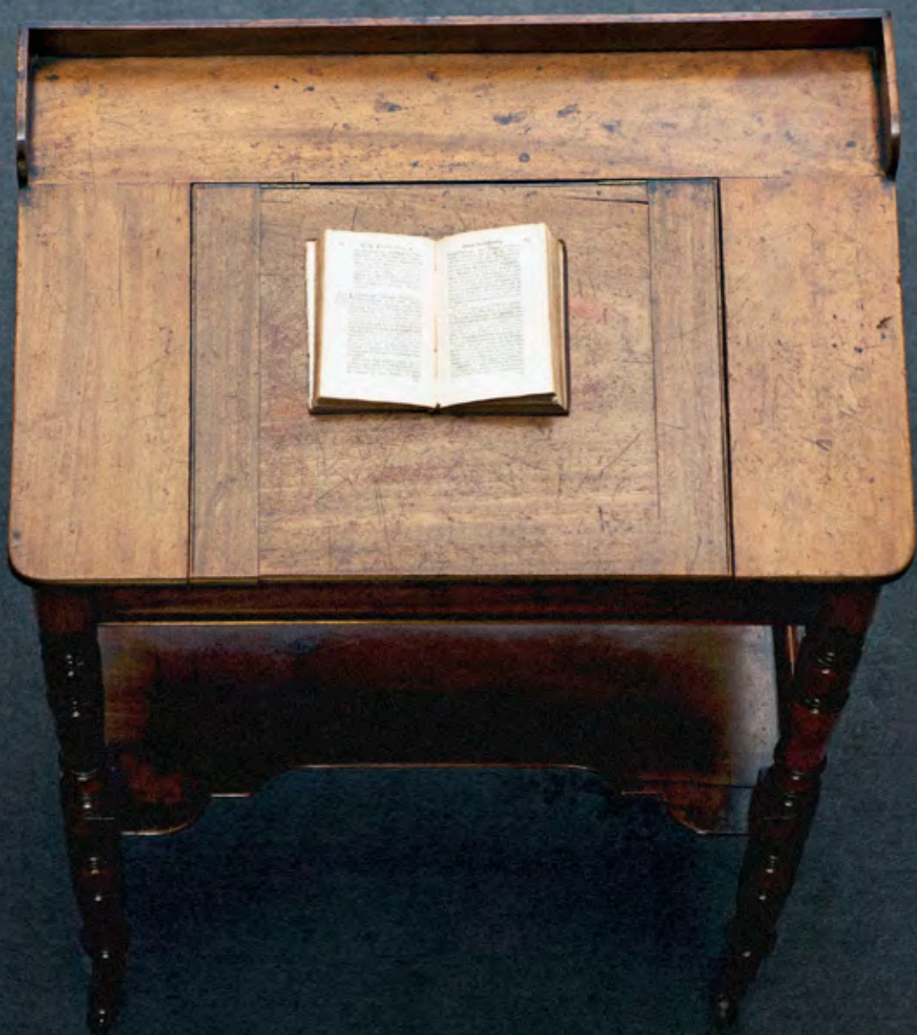
Escritorio de Newman en su librería donde escribió "Apología pro vita sua", Oratorio de Birmingham