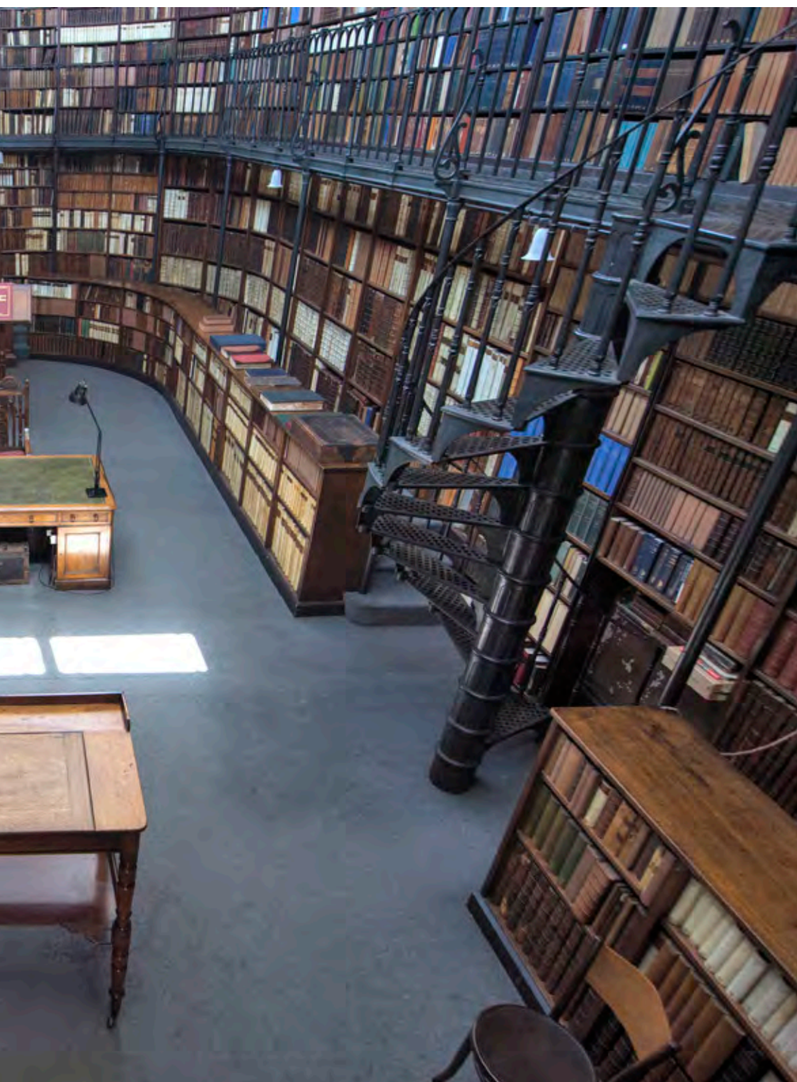
Librería privada de John Henry Newman en el Oratorio de Birmingham.