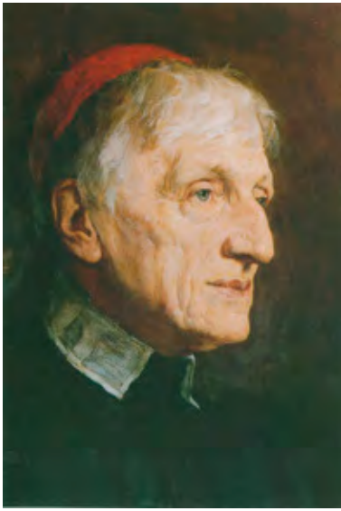
John Henry Newman.

El problema abordado por Newman tiene una doble cara. Una es preponderantemente filosófica, y trata de las condiciones de posibilidad de la certeza en el conocimiento en general, independientemente de la eventual creencia religiosa. La otra cara es teológica, pues se refiere a las condiciones que hacen posible un asentimiento de fe en la que se base una vida cristiana plena, en la que se integren armónicamente el pensamiento, los afectos y acciones comprometidas y congruentes con esa fe.