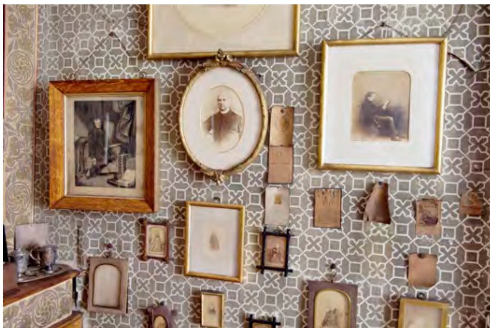
Recuerdos de amigos del Cardenal Newman al costado del altar de su capilla, Oratorio de Birmingham.

Especialmente digna de destacar es también la profunda huella del cardenal Newman en el Concilio Vaticano II, que incluso ha sido llamado “el Concilio de Newman”. Algunos de los más influyentes teólogos que participaron en el Concilio se reconocieron deudores de su pensamiento, entre ellos Charles Journet, Yves Congar, Henry de Lubac, Hans Urs von Balthasar. Un sello característico del Concilio fue la renovada recepción de los Padres de la Iglesia, a lo que contribuyó el impulso inicial de Newman con el Movimiento de Oxford. Y en los documentos del Concilio se nota su influencia, por ejemplo, respecto de la fe en tanto que asentimiento no fundado en meros argumentos lógicos, sino en la adhesión a la persona de Jesucristo, Palabra de Dios que se autocomunica, encarnándose en el mundo. 16 No menos importante es el enfoque histórico de la revelación y de la salvación, así como la centralidad de Cristo en esta historia. Todos los documentos del Concilio están atravesados por este enfoque. Así, por ejemplo, en la constitución dogmática Dei Verbum se encuentra la afirmación de que la revelación no es un mero conjunto de proposiciones,