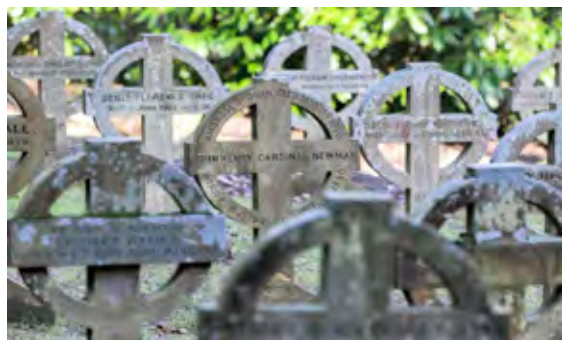
Tumba original en Rednal donde fue enterrado el cardenal Newman

En segundo lugar, la vida de Newman “nos enseña también que la pasión por la verdad, la honestidad intelectual y la auténtica conversión son costosas”, porque el cristiano tiene que dar testimonio de la verdad, aunque ello signifique sacrificio y dolor. Por último, “Newman nos enseña que, si hemos aceptado la verdad de Cristo y nos hemos comprometido con él, no puede haber separación entre lo que creemos y lo que vivimos”.