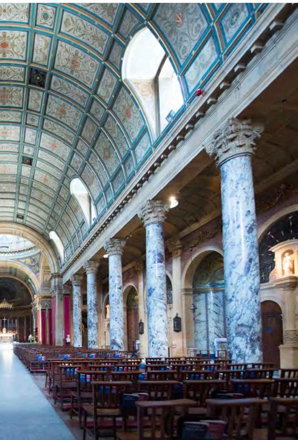
Oratorio de Birmingham