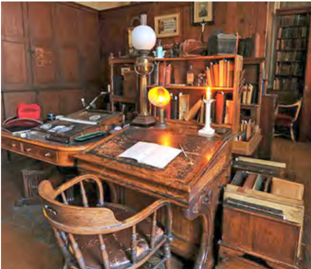
Escritorio del Cardenal Newman, en el Oratorio de Brimingham