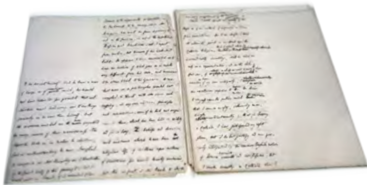
Manuscrito de "Apología Pro Vita Sua", Oratorio de Birmingham

Desde el lado anglicano fue acusado por el escritor Charles Kingsley de ser deshonesto y promover la mentira en la Iglesia. La respuesta de Newman fue la Apología pro vita sua (1864) 4 , en la que relata su evolución espiritual de manera pormenorizada, sin descalificar a la iglesia a la que había servido, con hondura humana y religiosa, además de brillantez literaria, rasgos que le han valido ser comparada con las Confesiones de San Agustín. El gran éxito de este libro le permitió recuperar el prestigio dañado por las acusaciones en