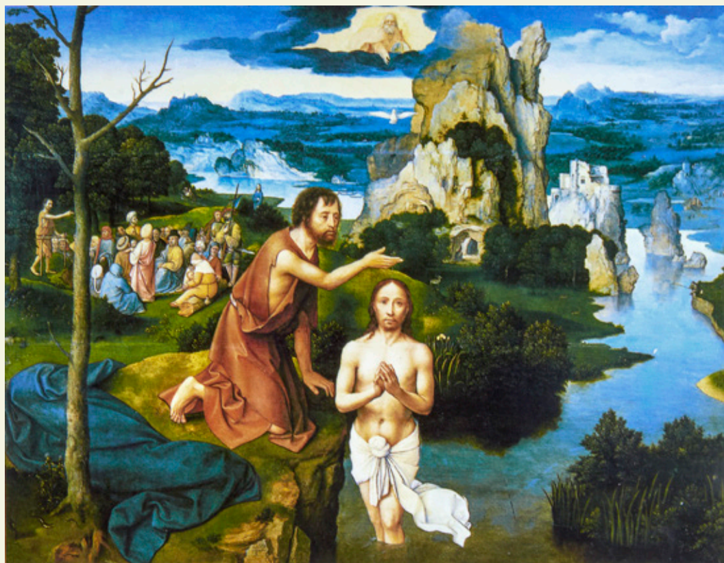
“Bautismo de Cristo” de Joachim Patinir, 1515.