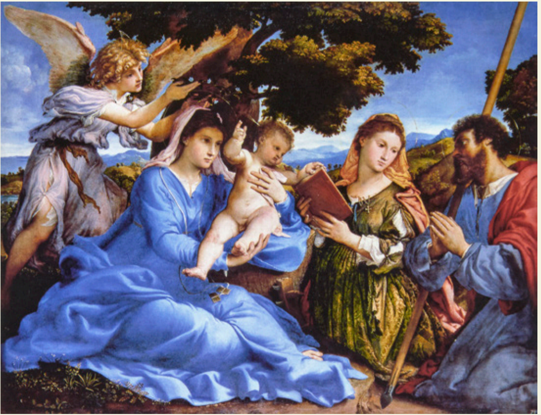
“La Virgen con el Niño y santos” de Lorenzo Lotto, 1527-1529.