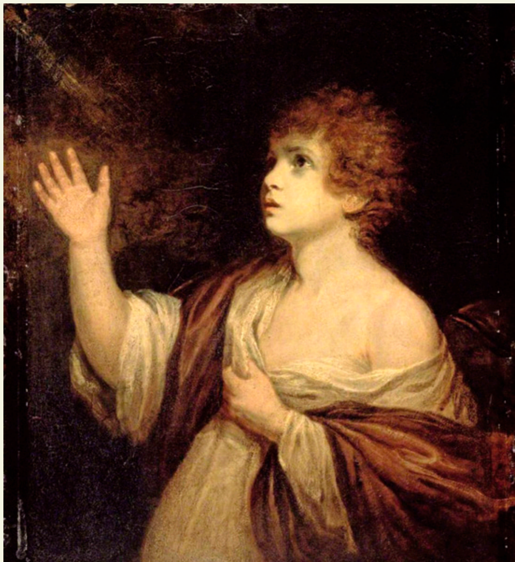
“La llamada de Samuel” de Sir Joshua Reynolds, 1776.