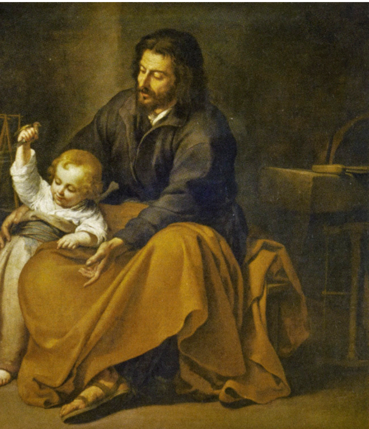
“La Sagrada Familia del pajarito” de Bartolomé Esteban Murillo, 1650.