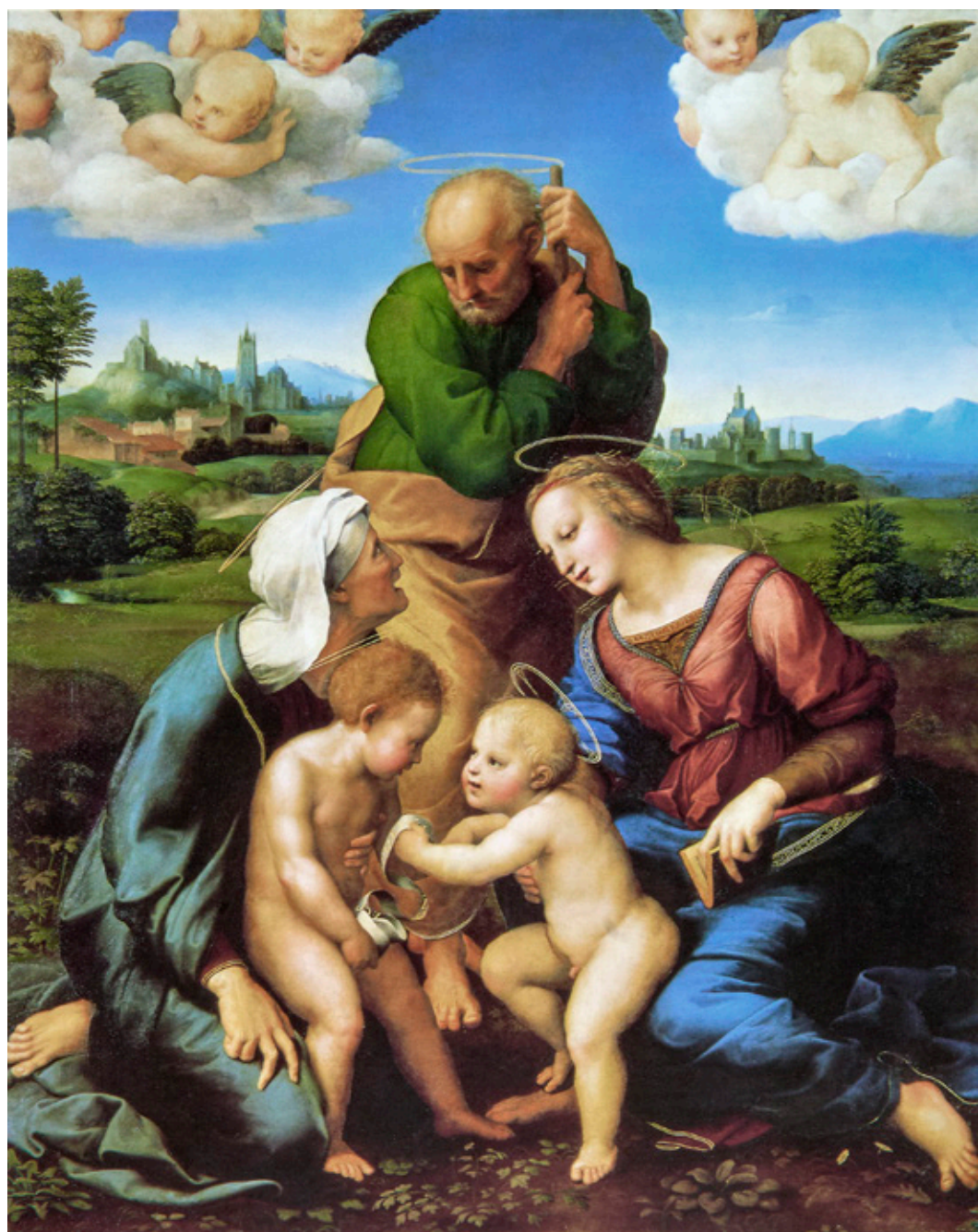
“Sagrada Familia Canigiani” de Rafael, 1507.