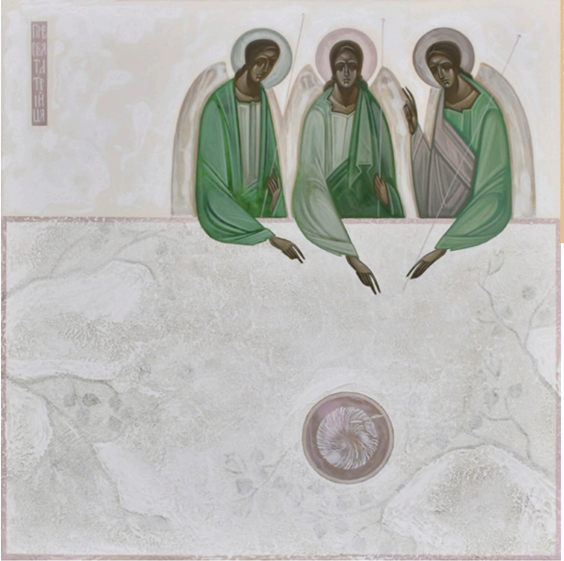
“The Holy Trinity” por Khrystyna Kuyk, Ucrania, 2021 (Tablero, yeso, acrílico).