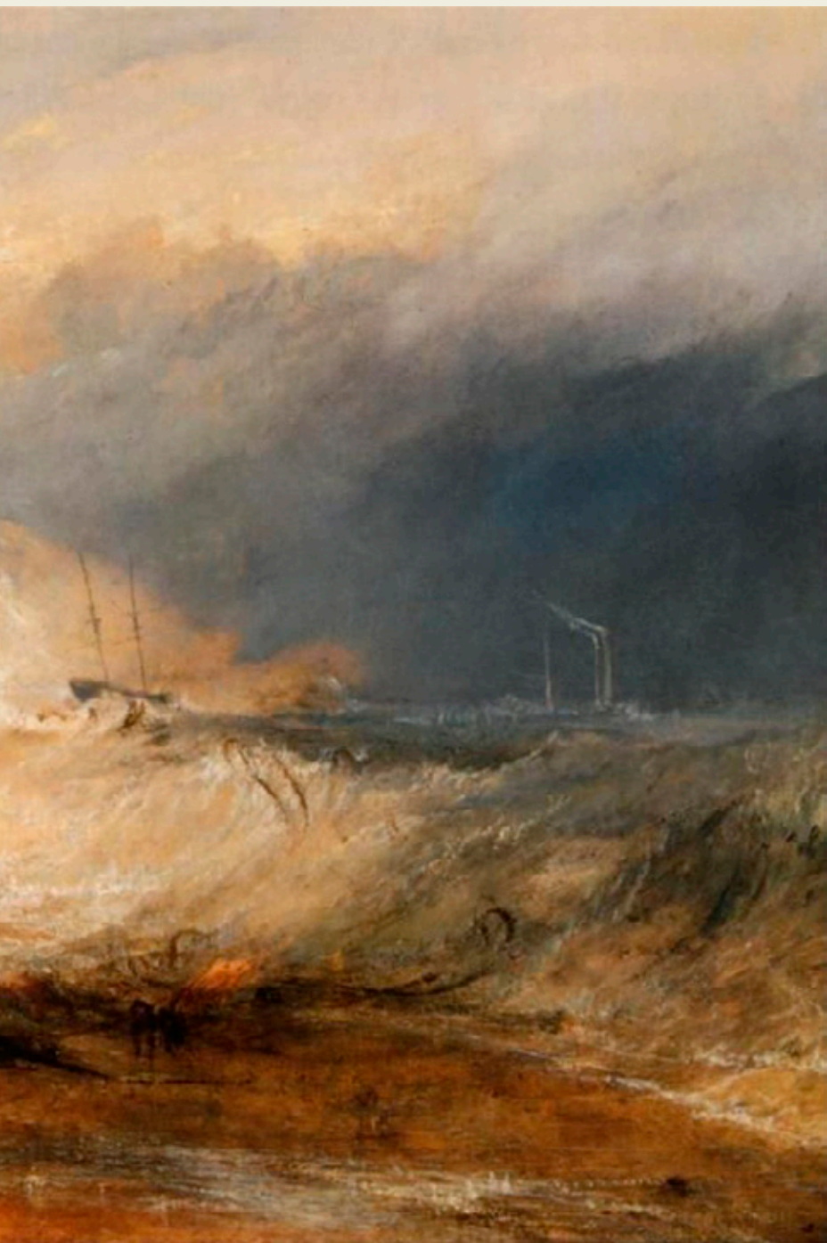
“Wreckers Coast of Northumberland” por J.M.W. Turner, c. 1834 (Óleo sobre tela).