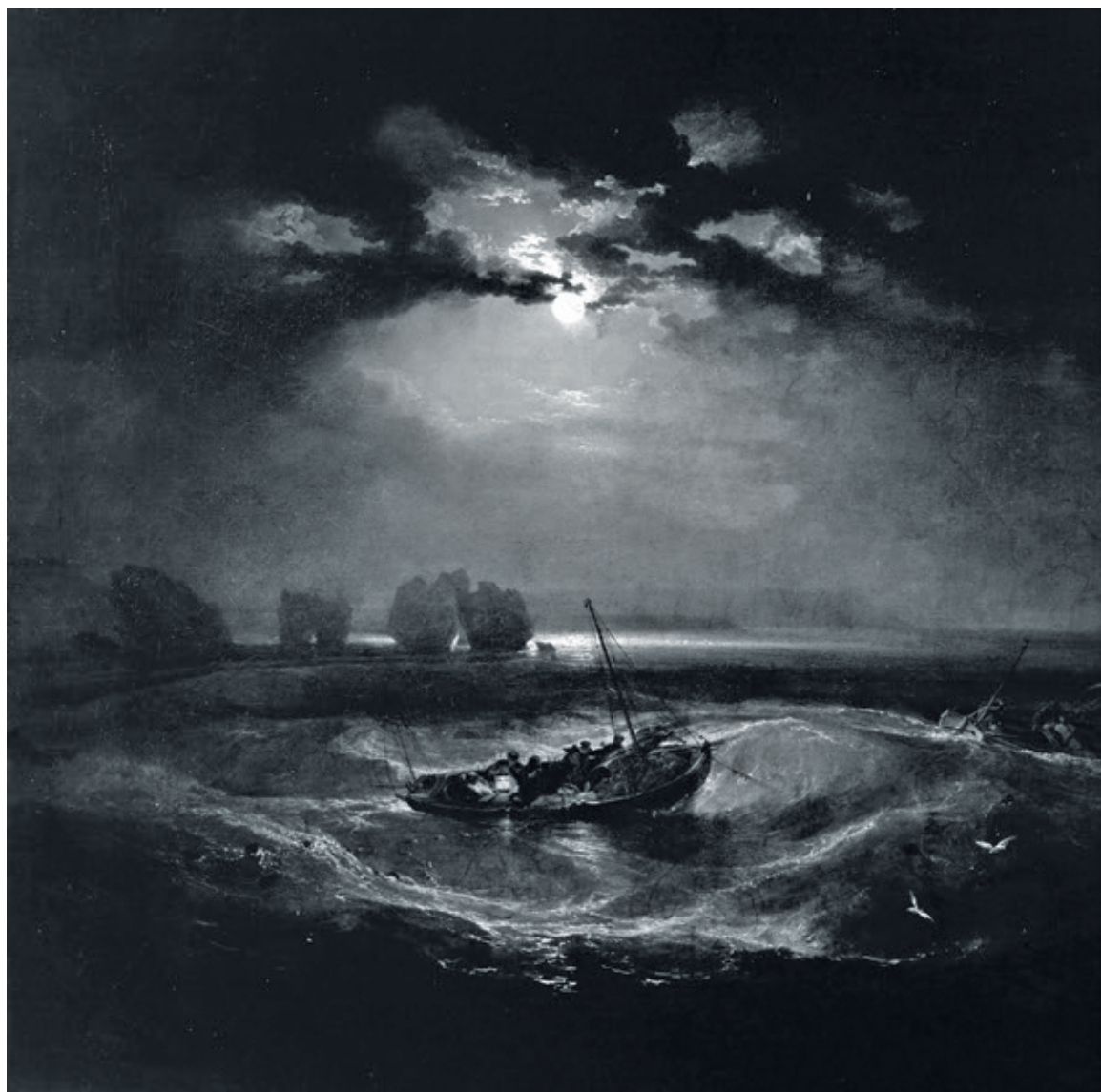
“Fishermen at sea” por J.M.W. Turner, 1796 (Óleo sobre tela).