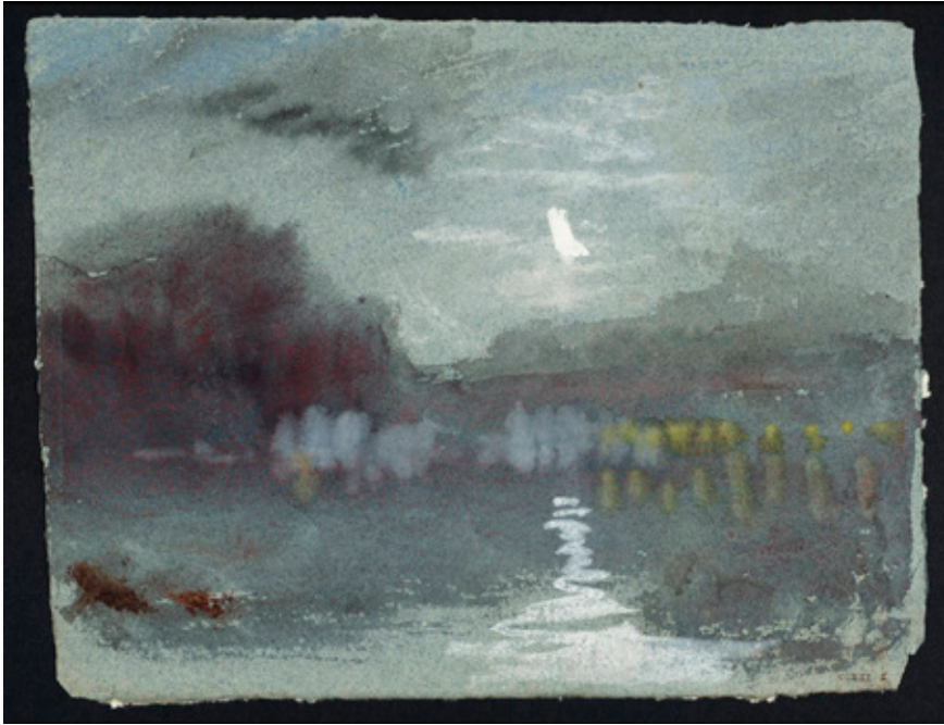
"Moonlight on river" por J.M.W. Turner, ca. 1826 (Aguada y acuarela sobre papel).