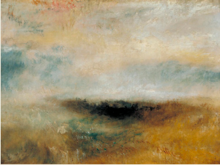
“Seascape with Storm Coming On” por J.M.W. Turner, ca. 1840 (Óleo sobre tela).