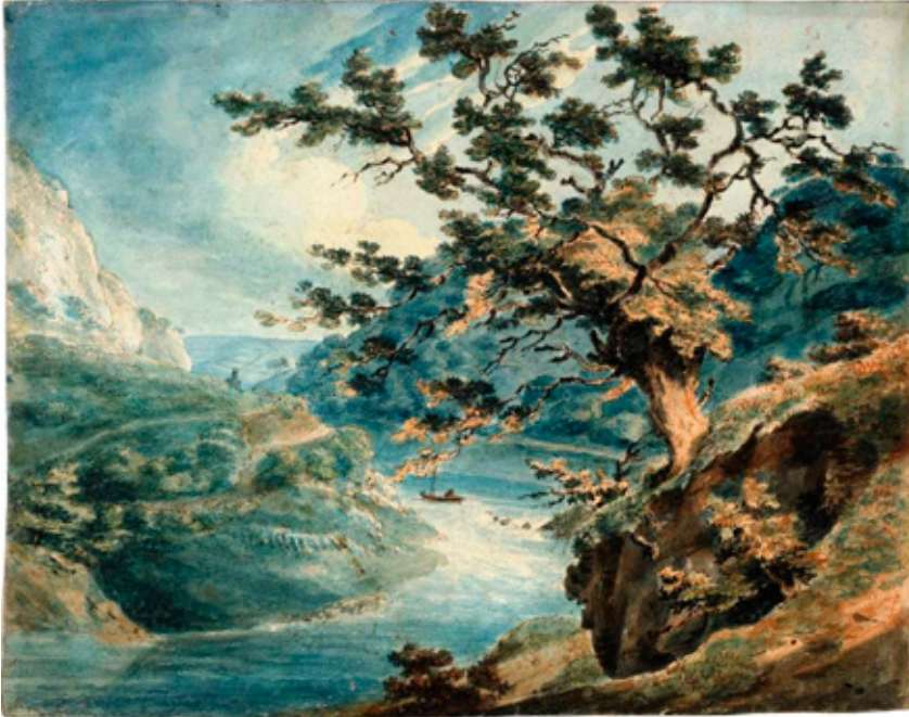
“View in the Avon Gorge” por J.M.W. Turner, 1791 (Pluma, tinta y acuarela sobre papel).

Para Kierkegaard la expresión directa de la religiosidad es un signo de envanecimiento, el cual advierte a través del siguiente ejemplo: “Si tres predicadores disputan por el honor de ver quién es el mayor pecador y luchan a capa y espada por semejante dignidad, entonces, naturalmente, dicha expresión piadosa se ha convertido para ellos en un título mundano” 32 . De este modo, “el hombre que en absoluta interioridad pretende hacerse consciente de que es un elegido, carece eo ipso de interioridad, puesto que su vida es comparativa” 33 . El humor como incógnito de la existencia auténticamente religiosa es, para Kierkegaard, un signo de madurez espiritual: “La religiosidad humorística, en tanto que incógnito, es la unidad de la absoluta pasión religiosa (profundizada dialécticamente) y la madurez espiritual que lleva al sentimiento religioso desde lo exterior a lo interior, y ahí, nuevamente, es la absoluta pasión religiosa” 34 . Se puede afirmar, por tanto, que todo hombre religioso puede ser humorista, pero esto no quiere decir que todo humorista sea,