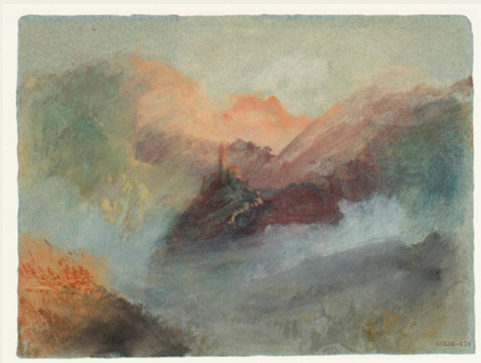
"Burg-Treis" por J.M.W. Turner, ca. 1839 (Aguada y acuarela sobre papel).