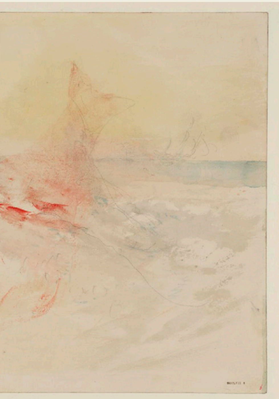
“A Harpooned Whale” por J.M.W. Turner, 1845 (Grafito y acuarela sobre papel).