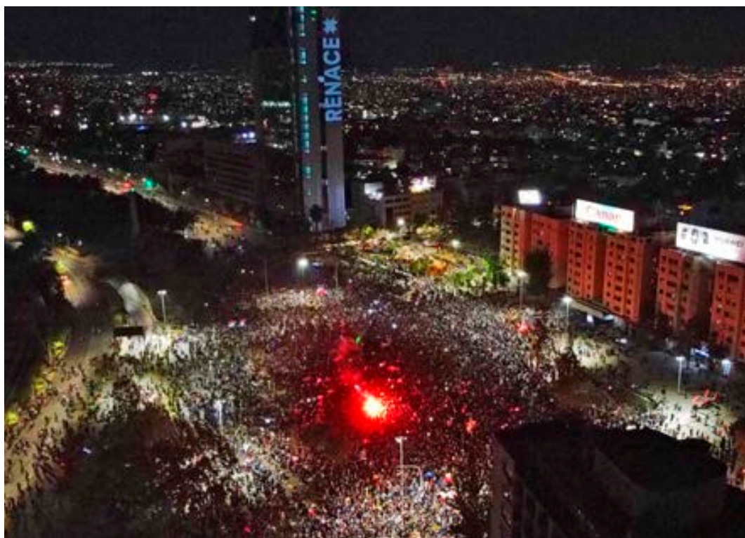
Proyección lumínica de la palabra "Renace" en el edificio ubicado en la esquina de Avenida Providencia con calle General Bustamante, a un costado de Plaza Italia.

Tras el resultado del Plebiscito Nacional 2020, el Comité Permanente de la Conferencia Episcopal de Chile señala que la jornada ha sido una gran muestra de civilidad y participación, expresando que en este nuevo caminar, el rol de la ciudadanía