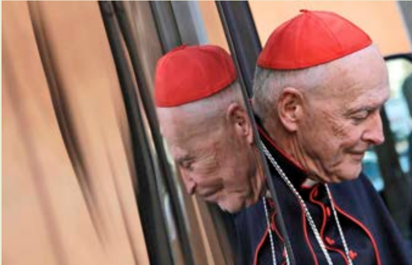
El entonces cardenal Theodore E. McCarrick es visto en el Vaticano en marzo del 2013.

En el momento del nombramiento del arzobispo en Washington Theodore McCarrick en 2000, la Santa Sede actuó sobre la base de información parcial e incompleta. Desgraciadamente, se cometieron omisiones y subestimaciones, se tomaron decisiones que después se evidenciaron equivocadas, entre otras cosas porque, en el curso de las verificaciones solicitadas por Roma en su momento, las personas interrogadas no siempre dijeron todo lo que sabían. Hasta 2017, ninguna acusación fundada se refirió a abuso o acoso de menores; tan pronto como llegó la primera denuncia de una víctima menor de edad en el momento de los hechos, el Papa Francisco actuó de modo rápido y con decisión contra el anciano cardenal, ya retirado de la conducción de la diócesis desde 2006, primero, quitándole el purpurado y, luego,