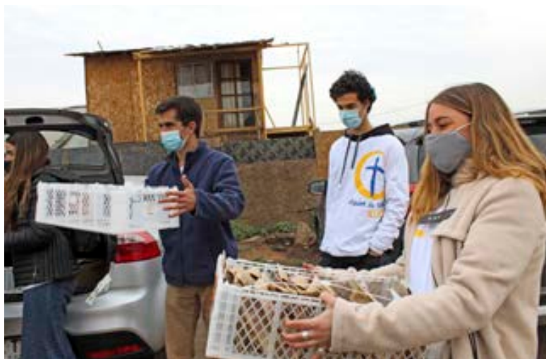
Misión de vida

Como en muchos otros sectores de la sociedad, la Pastoral UC tuvo este año que reinventarse. Ya no podría realizar sus actividades de manera presencial, con centenares de alumnos viviendo y compartiendo juntos la fe. Pero la virtualidad le permitió sacar toda su creatividad y llevar así el mensaje del Evangelio a cientos de hogares dentro y fuera de Chile.