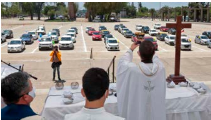
Auto-misa en la explanada del Templo Votivo de Maipú.

En el Santuario Nacional de Maipú optaron por innovar y celebraron la Solemnidad de la Inmaculada Concepción con una automisa para mantener la distancia social y evitar contagios. Hasta la explanada del Templo Votivo llegaron 50 vehículos cumpliendo todas las medidas sanitarias vigentes, en los que sus ocupantes anima-