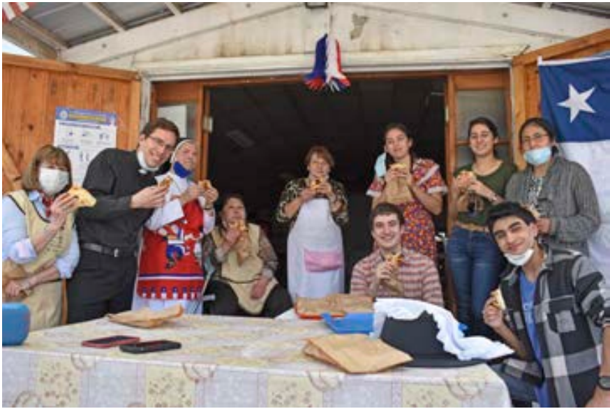
Comedor San José

desde su propio granito de arena, se puede hacer un Chile más humano y solidario". Por su parte el padre Fernando Valdivieso, capellán general de la UC, destacó en este proyecto "la energía de los jóvenes, su gestión de recursos" con lo cual "se pudo lograr esta apertura".