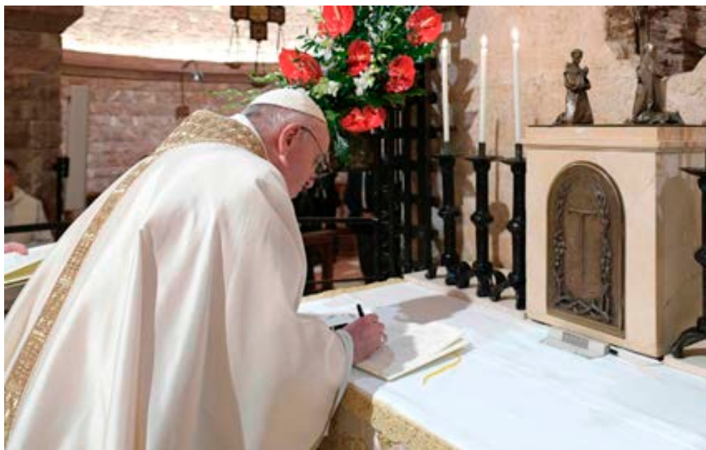
El Santo Padre firmó su nueva encíclica, “Fratelli tutti” en la tumba de Francisco de Asís el 3 de octubre.

S obre la tumba de Francisco de Asís, el santo que comprendió la fraternidad en cada criatura de Dios y la transformó en una canción atemporal, el Papa firmó el 3 de octubre su tercera encíclica, después de Lumen fidei , en 2013, y Laudato si , en 2015. Se trata de Fratelli tutti , dedicada al tema de la fraternidad y la amistad social, valores esenciales para devolver la esperanza y el impulso a una humanidad herida incluso por la pandemia de Covid-19.