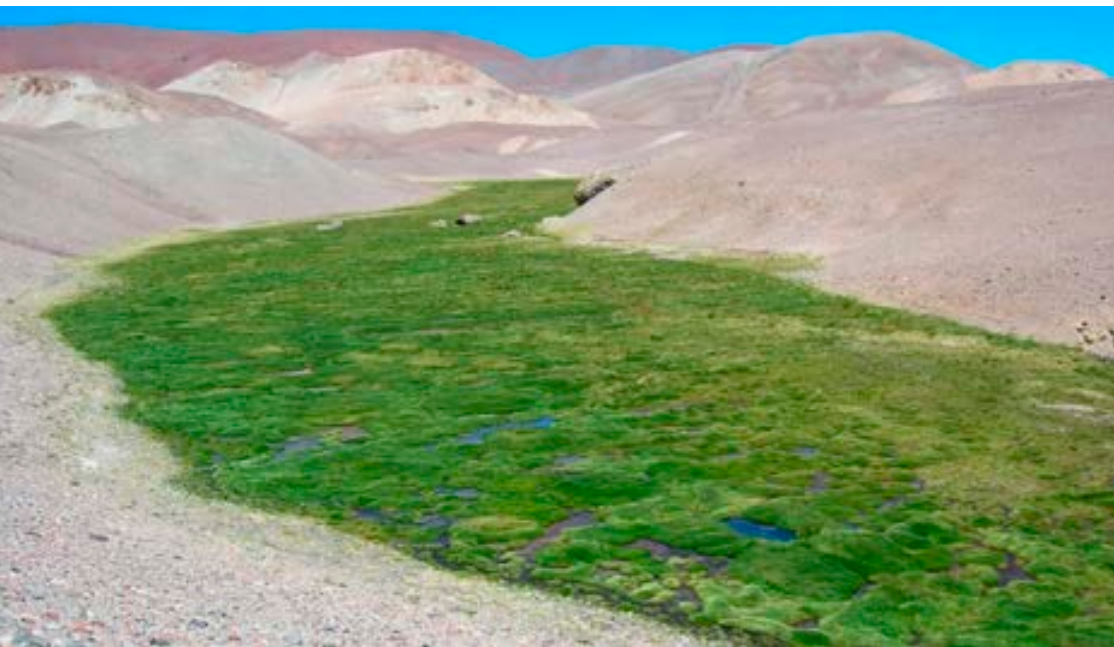
Humedal en el río Loa.

E n el marco del Tiempo de la Creación, el equipo de Medio Ambiente, Gestión de Riesgos y Emergencias de Caritas Chile presentó la sistematización del Proyecto “Respuestas Locales de adaptación comunitaria al cambio climático. Experiencias comunitarias desarrolladas en Calama, Santiago y Aysén”, lo que sirvió para compartir el trabajo desarrollado por seis comunidades, respecto al diseño e implementación de medidas de adaptación a los efectos del cambio climático.