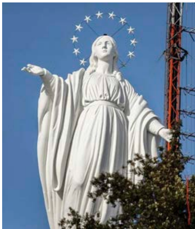
Virgen Inmaculada del cerro San Cristóbal recién restaurada.

Este año, el ahora arzobispo de la Arquidiócesis de Santiago presidió la celebración en un momento sin precedentes, no solo a nivel mundial, sino a nivel social y político en el país. El obispo encomendó a asistentes y