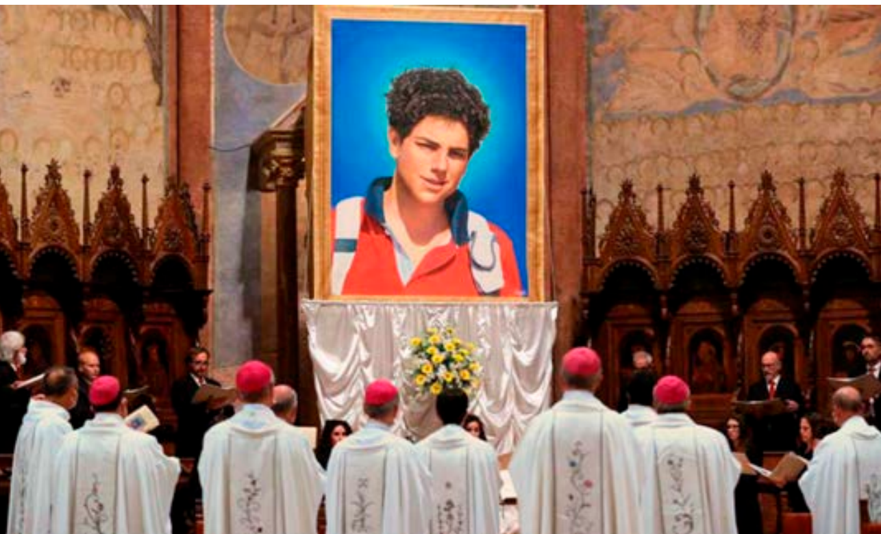
Carlo Acutis fue beatificado en la tarde del sábado 10 de octubre en la Basílica Papal de San Francisco en Asís.