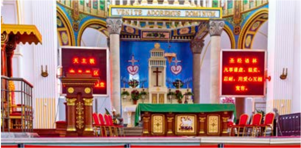
Catedral de San Miguel, iglesia católica construida por misioneros alemanes en Qingdao, provincia de Shandong, China.

La Santa Sede y la República Popular China han decidido prorrogar por otros dos años el Acuerdo Provisional para el nombramiento de obispos, aprobado el 22 de septiembre de 2018 en Beijing, y que caducaba el 22 de octubre.