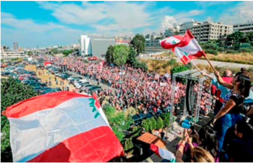
Imagen de las multitudinarias manifestaciones contra el gobierno iniciadas en el Líbano en octubre de 2019.

el Líbano, apelando a su historia tan acontecida y a su esencia de bastión de convivencia interreligiosa: