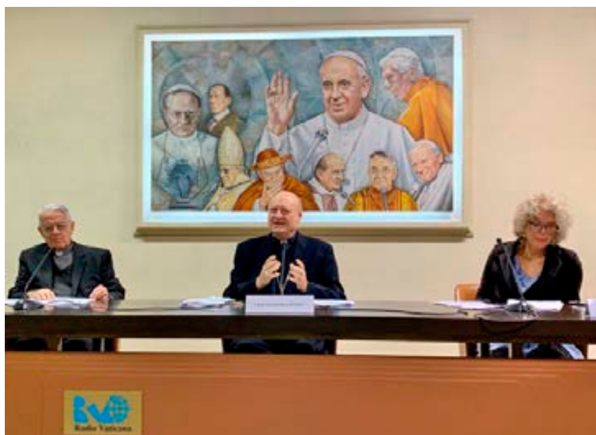
El Padre Federico Lombardi, presidente de la Fundación Pontificia Joseph Ratzinger, realizó el anuncio en una rueda de prensa que se realizó en la Sala Marconi de Radio Vaticano.

giraría en torno al pensamiento teológico de Ratzinger-Benedicto XVI. Esperamos que la pandemia u otras dificultades no nos impidan llevar a cabo este hermoso proyecto”, dijo el padre Lombardi.