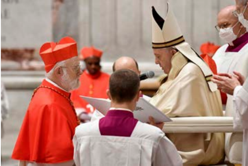
Monseñor Celestino Aós es creado Cardenal.

E l domingo 25 de octubre, el Papa Francisco anunció la creación de trece cardenales durante un consistorio ordinario público que se celebró el sábado 28 de noviembre. Pertenecen a cuatro continentes: Europa, África, Asia, América Latina y América del Norte, y nueve de ellos son menores de ochenta años.