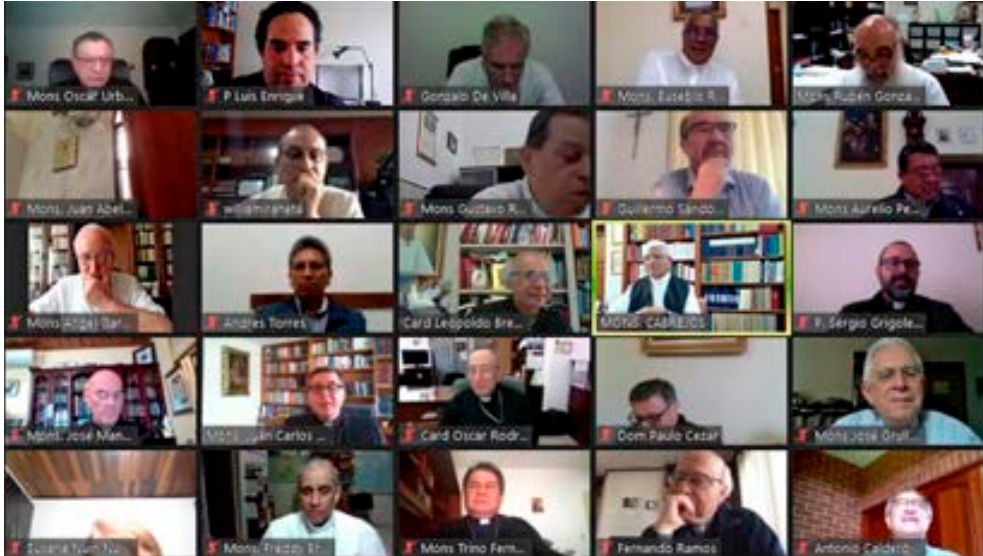
Reunión virtual de la presidencia del Consejo Episcopal Latinoamericano con los Presidentes y Secretarios Generales de las 22 Conferencias Episcopales de América Latina y el Caribe, 21 de septiembre.

El 22 de septiembre se llevó a cabo la segunda jornada de la reunión entre las directivas del Consejo Episcopal Latinoamericano, los presidentes y secretarios generales de las 22 Conferencias Episcopales de América Latina y el Caribe. Un encuentro que sirvió para conocer la línea de tiempo que ha determinado las acciones del proceso de reestructuración y renovación del organismo colegiado.