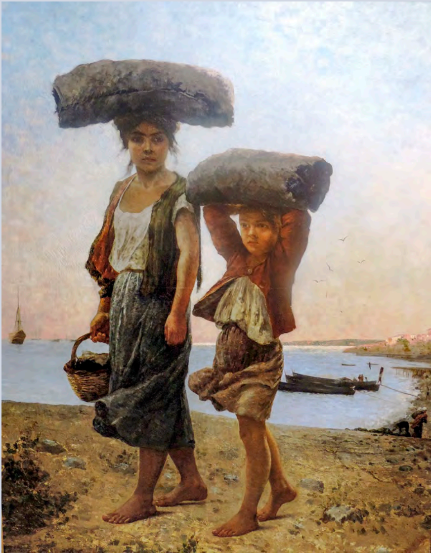
“Las playeras” por Celia Castro, 1889 (Óleo sobre tela).