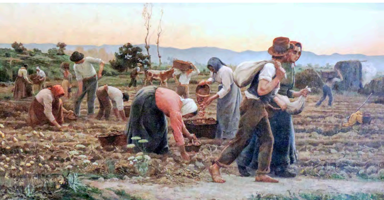
“Cosecha de papas” por Pedro Jofré, 1897 (Óleo sobre tela).

El sindicato, en cuanto corporación, apunta a “una concepción muy distinta a la que planteaban las vertientes socialistas, pues en el corporativismo