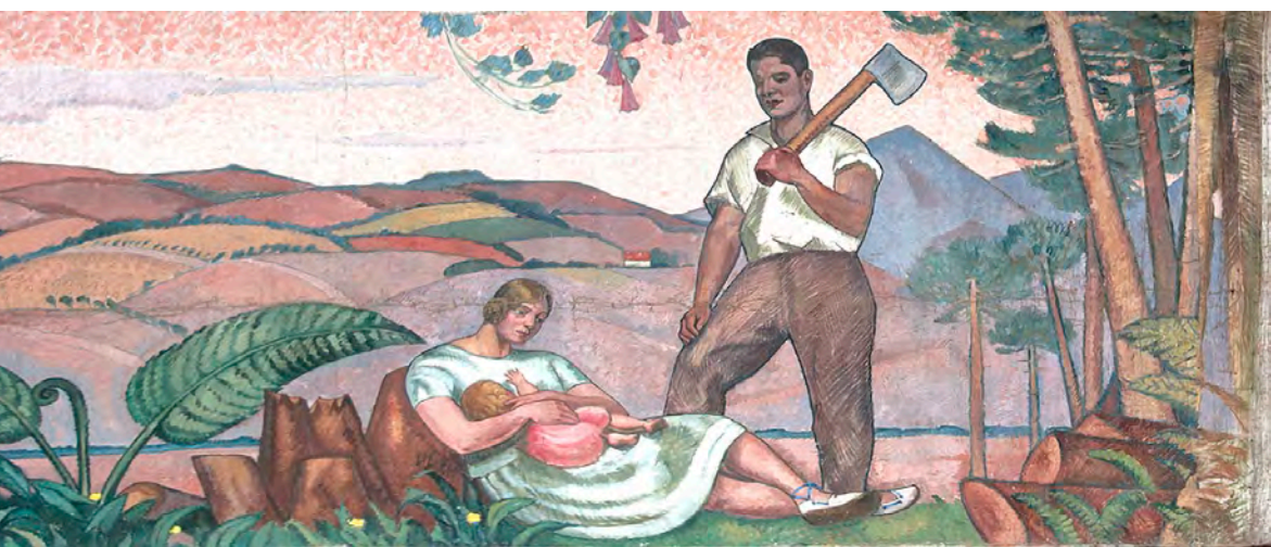
“La agricultura” por Laureano Guevara Romero, 1929 (Óleo sobre tela)

esto es que se hiciera contra nosotros. Una época de paternalismo bien intencionado, pero con ánimo de hacer madurar al obrero y de capacitarlo para que pueda tomar cuanto antes su tamaño natural, se impone, me parece. Lo que no es cristiano es que no hagamos nada porque el campesino no adquiera su tamaño natural, tamaño de hombre completo. Y lo triste sería que esta conquista se hiciera por otros que por nosotros. 25