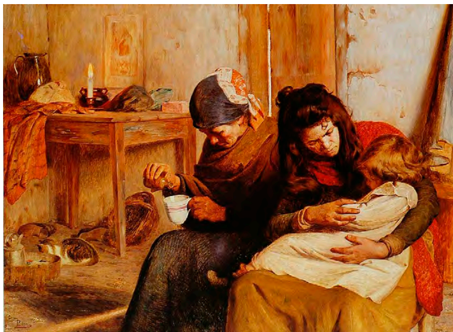
“El niño enfermo” por Pedro Lira, 1902.

La empresa de monseñor Errázuriz fue asumida años más tarde por monseñor José María Caro (1866-1958), quien en 1934 escribe al Papa Pío XI, solicitándole apoyo ante la simpatía que muchos sacerdotes y obispos sentían por el Partido Conservador, aun a prácticamente una década de la separación entre la Iglesia y el Estado. Esta solicitud era otra forma de decir que el clero no estaba simpatizando con la doctrina en los temas sociales que emergían de la Santa Sede. El cardenal Pacelli, quien luego sería Pío XII, escribió la respuesta. En ella estableció que “un católico puede pertenecer a cualquier partido político con tal que éste diera garantías a la Iglesia”. 10 Esta carta hace que se desligue la Iglesia chilena del Partido Conservador, a la vez que influye en la creación de un nuevo partido político en 1938 por parte de la juventud católica, en quienes la encíclica Quadragesimo anno tuvo especial resonancia: la Falange Nacional.