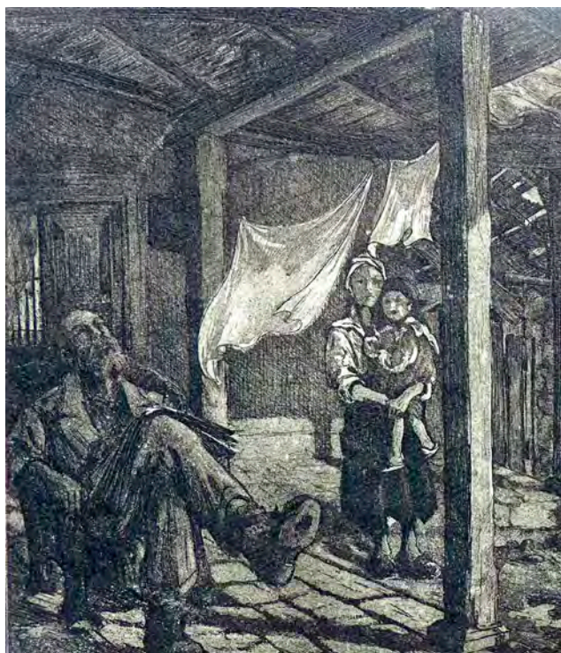
Sin título por Ciro Silva, ca 1952 (Aguatinta).

primera reflexión sobre temas sociales que la Iglesia hiciera 1 ; sin embargo, es con esta intervención con la cual se inaugura la Doctrina Social de la Iglesia 2 . Esencialmente, en esta encíclica queda expuesta la posición de la Iglesia Católica frente a la situación de explotación en la cual vivía una gran mayoría de la población asalariada, producto de los efectos perniciosos de la revolución industrial europea.