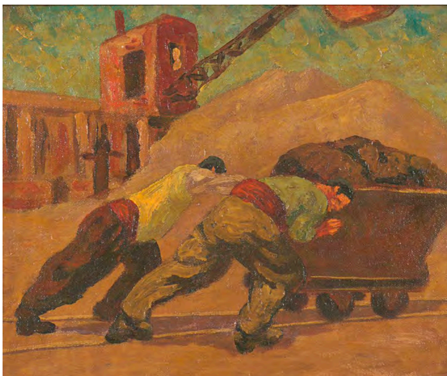
Mineros en obra de Pedro Luna, s/f.

En tiempos de una precaria legislación que favorecía la declarada explotación de una buena proporción de los obreros en Chile, el padre Hurtado reflexiona, actúa y levanta la voz a favor de la creación de una sociedad más justa. Esto en tiempos en que la Iglesia en Chile tenía serias dificultades para asumir la naciente Doctrina Social de la Iglesia.